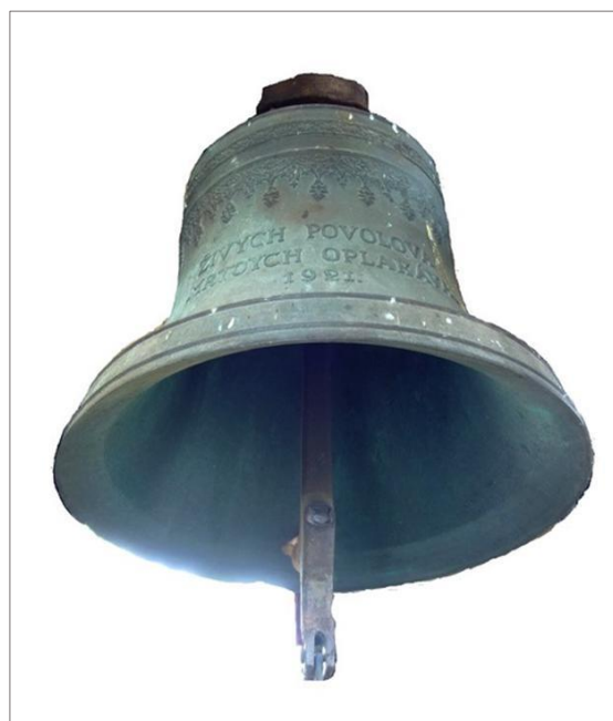
Veľký zvon z roku 1921