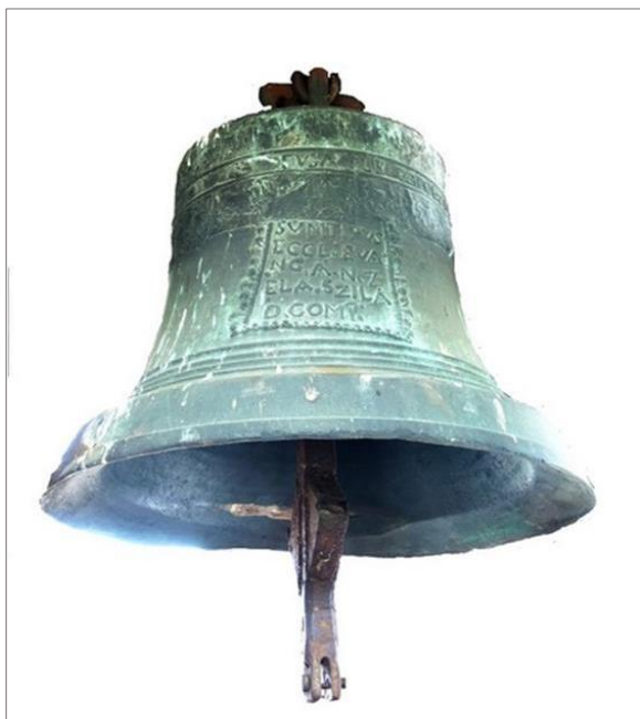
Malý zvon z roku z roku 1792

...eus... per Carolum Tyrnavia s hmotnosťou 120 kg je vysoký 47 cm, priemer 57 cm a výška srdca je 43 cm. Na samotnej veži je